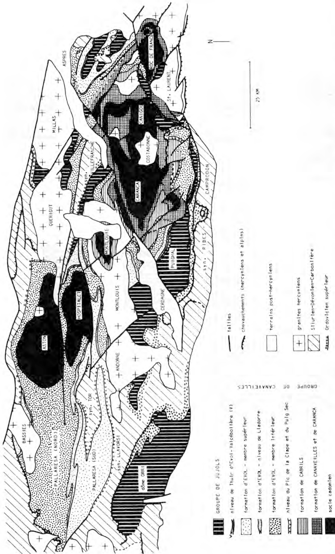
Fig. 2: Carte géologique simplifiée du Paléozoïque inférieur des Pyrénées orientales. Cette carte montre clairement la transgression du groupe de Canaveilles du SE (Canigou) vers le NW (Aston), le grand développement de la formation d'Evol dans les régions occidentales et la discordance de l'Ordovicien supérieur, matérialisée par la disparition du groupe de Jujols vers le NW. Fig. 2: Simplified geologic map of Lower Paleozoic of Eastern Pyrenees.